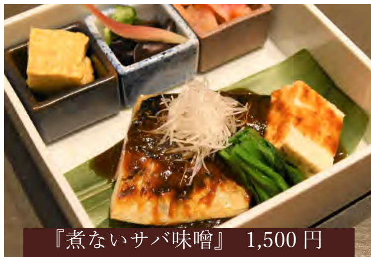
『煮ないサバ味噌』 1,500 円