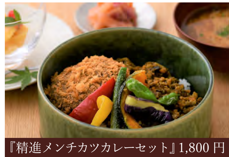
『精進メンチカツカレーセット』 1,800 円