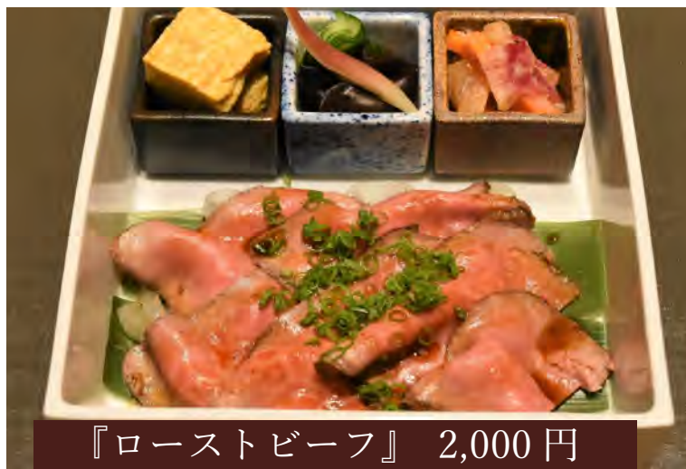
『ローストビーフ』 2,000 円